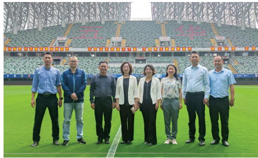
调研组一行先后走访横陂足球小镇、五华县奥体中心等，详细了解五华县足球历史文化、足球产业发展等情况。随后，双方在县政府召开座谈会。五华县文

旅旅体局、教育局、科工商务局、卫健局、农业农村局与广州体育学院科学技术部、图书馆、发展研究中心(学科规划办公室)等部门主要负责人就师资科研能力提升、体育浸润行动计划、体育产业发展规划、校园足球建设、体育场馆运营、教师发展中心信息化建设、乡村学校阅读课程建设等内容进行深入交流，形成合作共建意向。