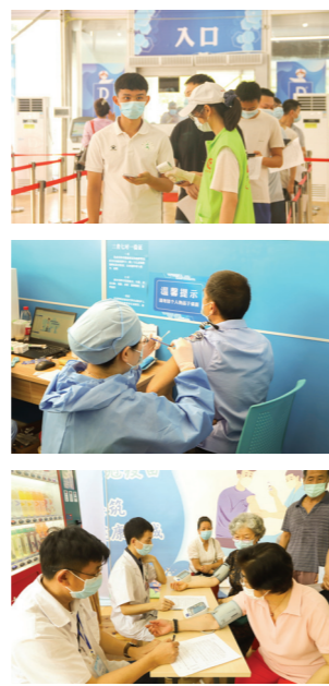
苗接种工作。按照应种尽种、知情自愿的原则,学校在天河体育中心对符合接种条件、有接种意愿

的师生员工进行新冠疫苗集中接种。此前为确保新冠疫苗接种工作顺利开展,学校高度重视,周密部署,制定工作方案,积极引导鼓励广大师生分批分次接种。