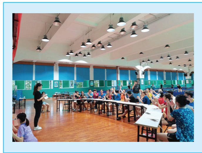
和民族的希望,应当争做有担当、有追求、有作为的新青年。

5月21日下午,院乒乓球队代表队在球馆二楼乒乓球室开展“你话我猜”党史知识竞赛主题活动。小组比赛妙趣横生,红四军队、粤港澳大湾区队、非常敬业爱党队、爱岗敬业爱人民队四个小组向冠军发起角逐,现场赛况激烈,各组同学纷纷举手抢答,不知不觉中将同学们带入到那些艰苦奋战的岁月中。接近尾声,大家仍沉浸在争先恐后抢答的氛围中,个个意犹未尽。通过游戏的方式学习党史,让党史学习变得更有趣味性,不仅增强了大家的学习积极性,也让党史更深入地镌刻在同学们心中。此次活动有十名党员和数名积极分子参加,引领同学们学习党的百年历史,激励同学们加入党组织的决心,进一步向中国共产党看齐。作为在新时代成长起来的当代青年大学生,我们承载着伟大的时代使命,肩负着未来