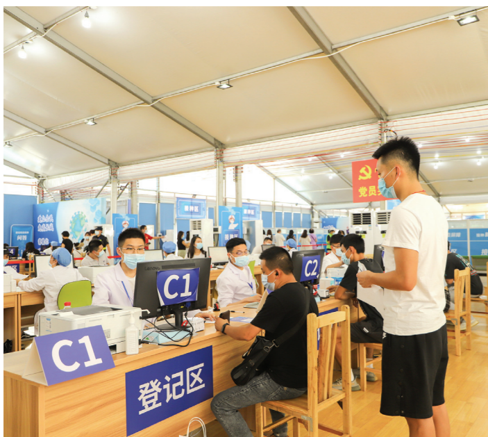
本报讯 全面构建校园免疫屏障,积极响应国家疫情防控政策,广州体育学院全面开启新冠疫