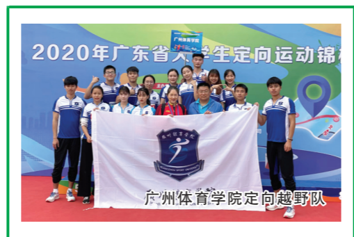
2020年广东省大学生定向运动锦标赛 广州体育学院定向越野队

即使冷静补救,那一次比赛中,正格也痛失冠军,仅与第一名相差数秒,“这些遗憾能成为我下一次发挥得更好的动力。定向越野环境情况多变,我们在暴雨的环境中奔跑过,也有过迷失方向,甚至走反了一大段路,我们需要迅速从急躁懊恼的心态中平静下来,也需要在赛后反思不足,所以我觉得定向赛是个很锻炼人意志的运动。”