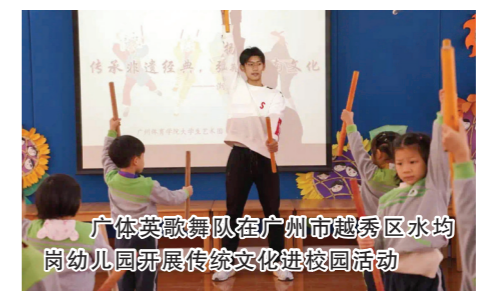
广体英歌舞队在广州市越秀区水均岗幼儿园开展传统文化进校园活动

英歌舞队成员大多怀着一颗对岭南文化的热爱之心,他们将紧跟潮流不断创新作为发展理念,近期正在尝试用新的方式排练节目,不再是单纯锣鼓等节奏作为简单配乐,而是结合潮州音乐、流行音乐等方式进行英歌舞节目编排。