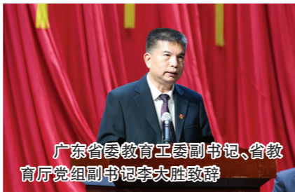
广东省委教育工委书记、省教育厅党组副书记李达胜致辞