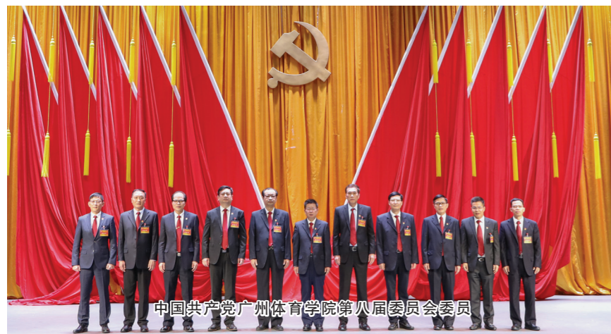
中国共产党广州体育学院第八届委员会委员