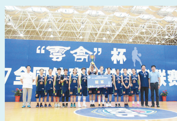
我校获得 2017 年全国体育院校女子篮球联赛冠军,取得了历史性突破,夺得建校 60 周年以来第一个女子篮球冠军。